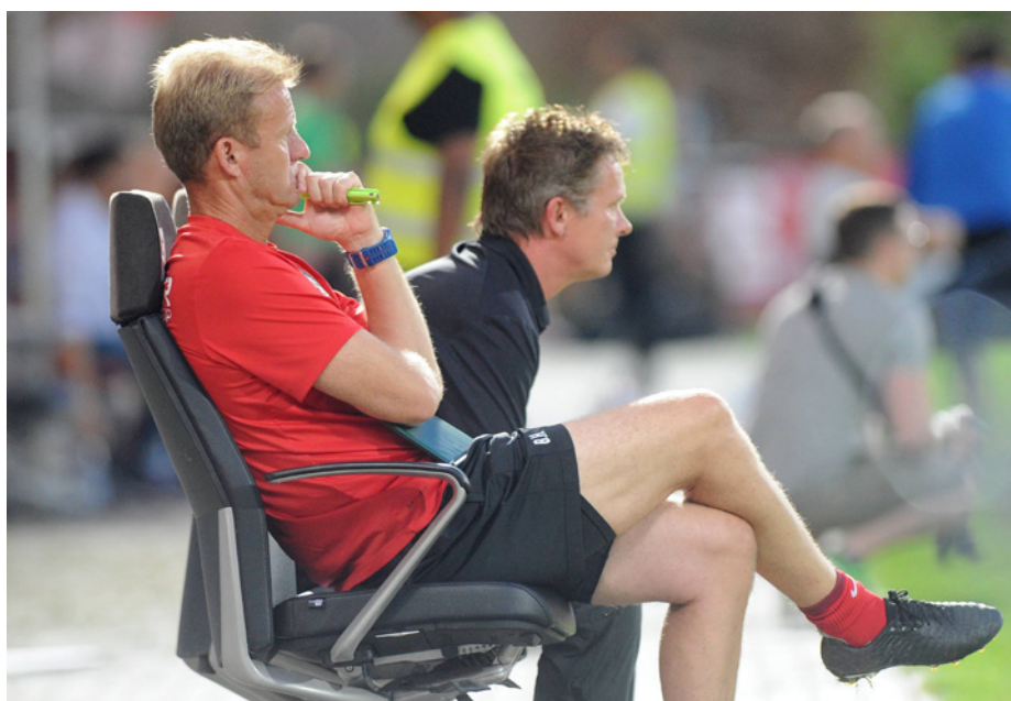
In Situation 1 geht es darum, wo innerhalb der Coaching-Zone die Trainerbank stehen darf.

Für den aktuellen Regel-Test hat DFB-Lehrwart Lutz Wagner Fragen zusammengestellt, die von Fußball-Trainern an ihn herangetragen wurden.