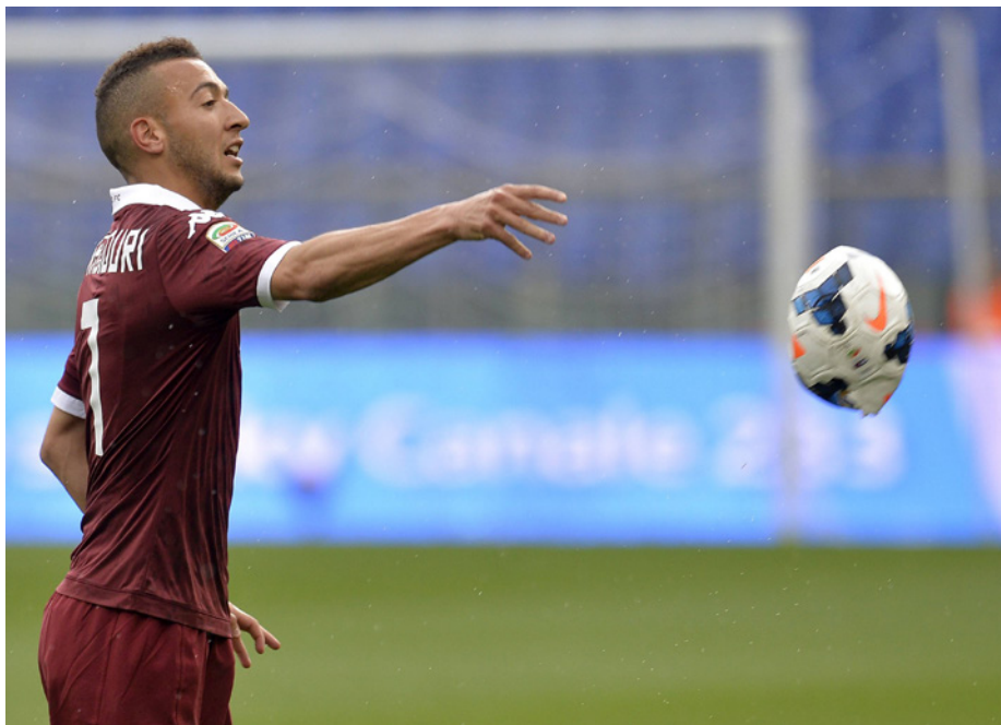
Mit dem kuriosen Fall, dass ein Spieler einen zuvor geplatzten Ball fängt, beschäftigt sich Situation 4.