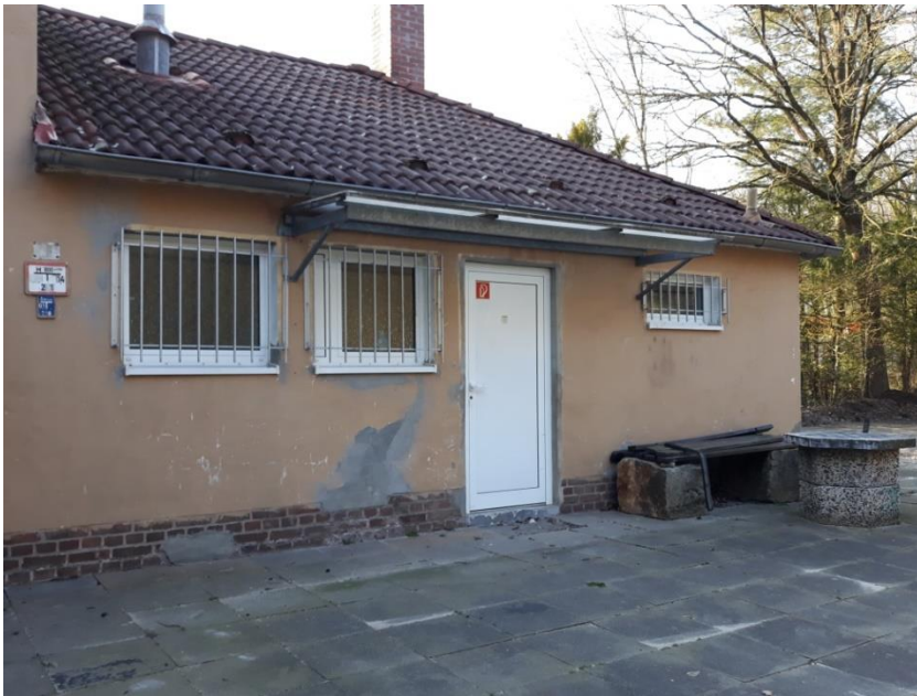
● Ausgang Heim Mannschaft